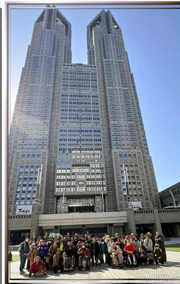
↓都庁の前で記念撮影です