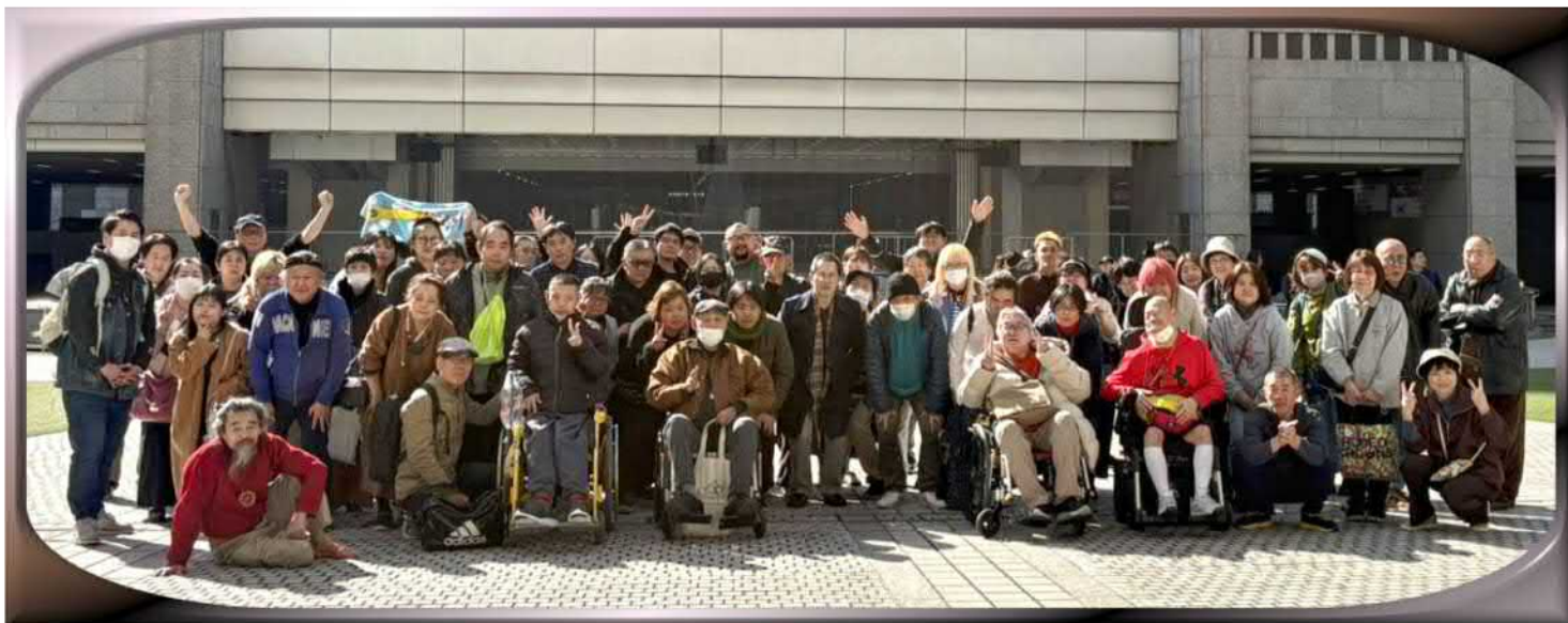
↑都庁の前で記念撮影です

●毎年開催している“えどがわ悠人会”合同レクですが、今回は3月5日(木)、新宿での楽しい食事会、そして東京都庁の展望室を見学してきました。 当日はバス2台を貸切、スタッフも含め74名の参加者でした。